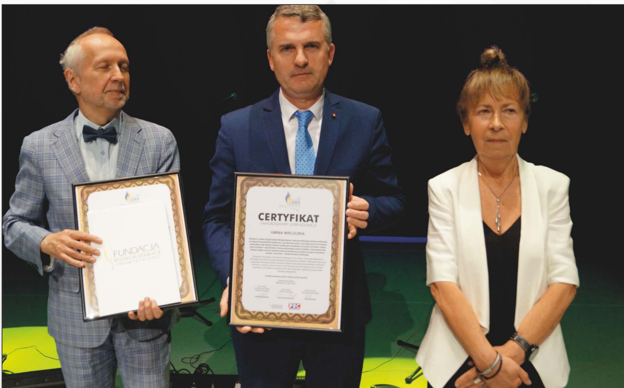
Certyfikat dla Gminy Wieliczka. Laureat w towarzystwie przedstawicieli Fundacji Rozwoju Edukacji i Szkolnictwa Wyższego.