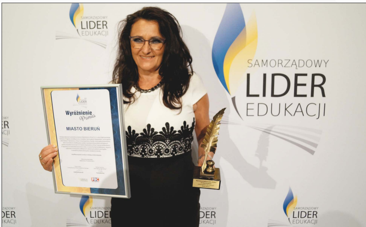
Wyróżnienie „Samorządowy Lider Edukacji” dla Miasta Bieruń. Pamiątkowa fotografia na ścianie promocyjnej.