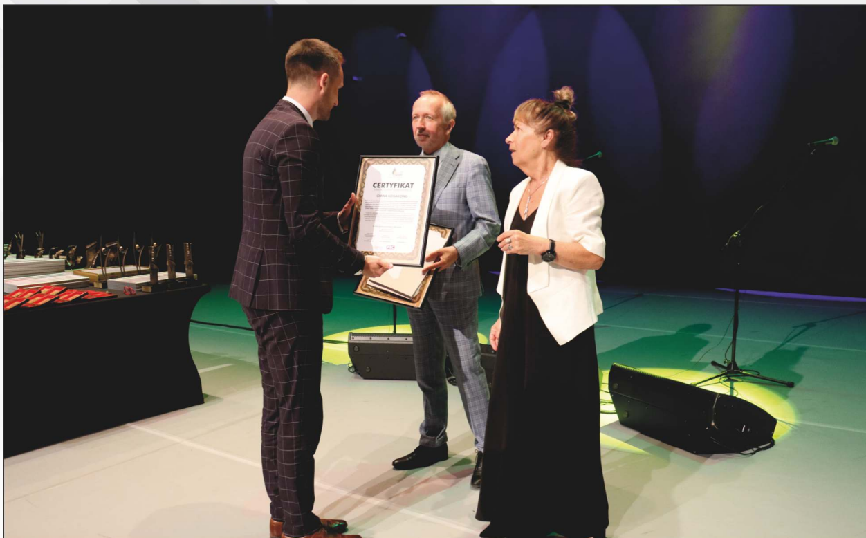
Akt uroczystego wręczenia Wyróżnień Nadzwyczajnych na scenie Filharmonii Kaszubskiej w Wejherowie. Certyfikat odbiera przedstawiciel Gminy Kosakowo.