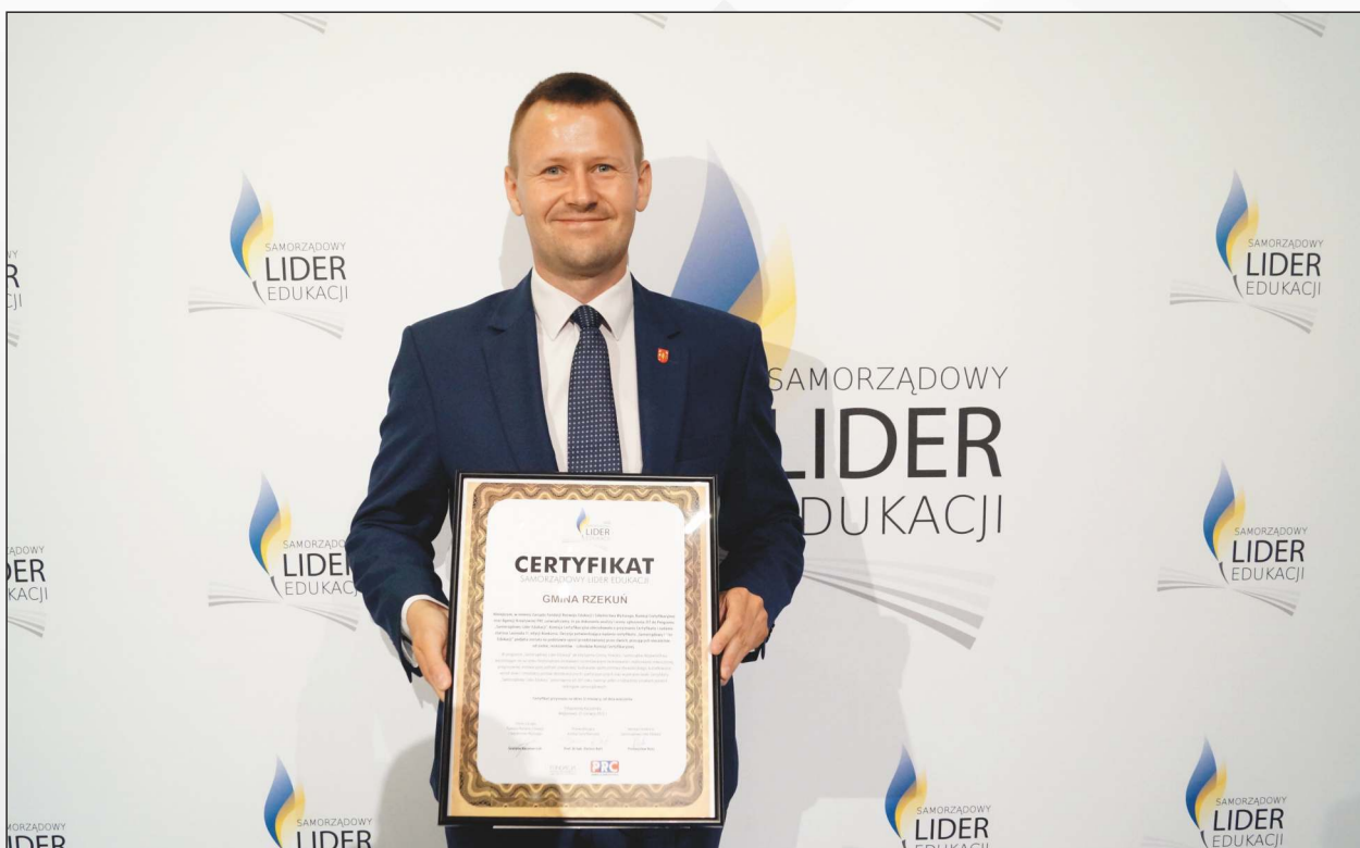
Jedno z wyróżnień przyznanych w 2022 roku trafiło do Gminy Rzekuń.