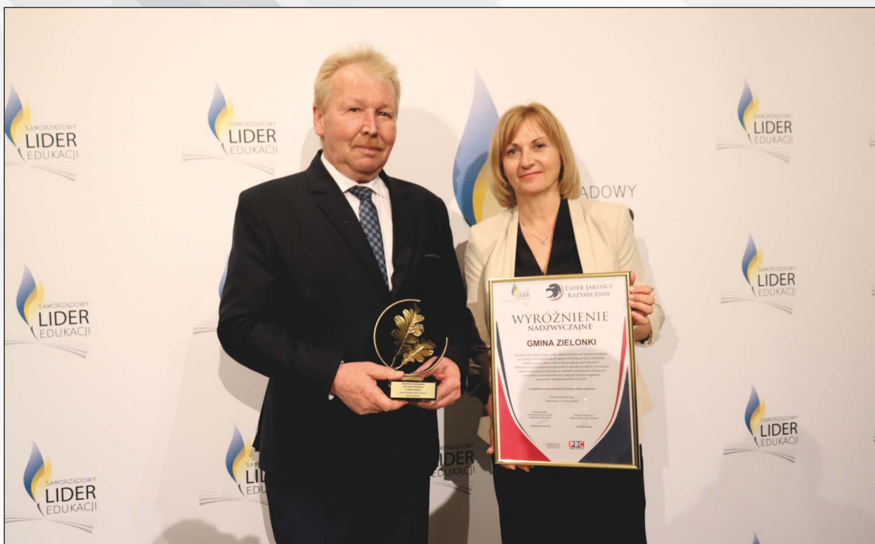
Gmina Zielonki – jedna z najczęściej nagradzanych gmin w Konkursie „Samorządowy Lider Edukacji”.