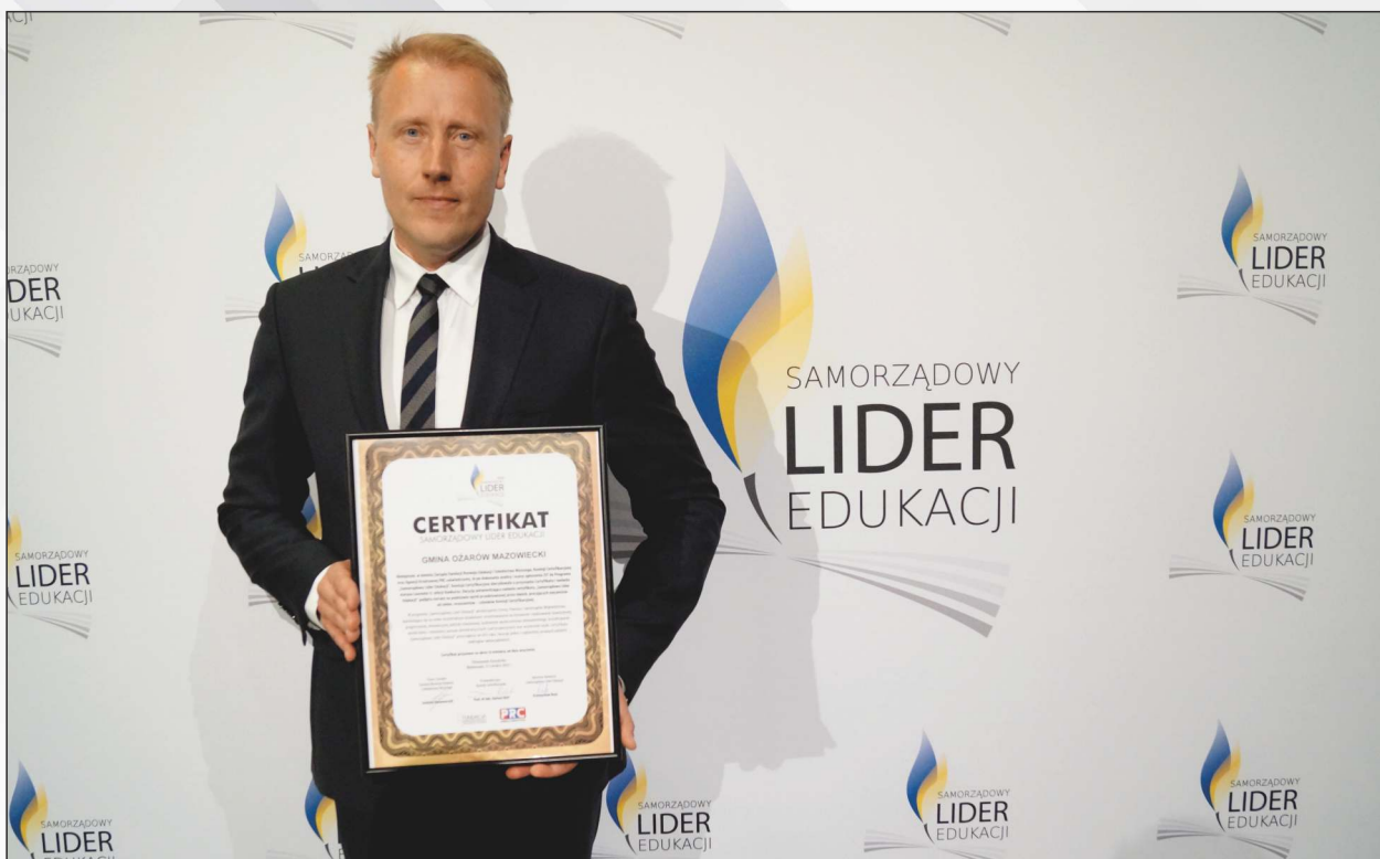
Nagroda dla Ożarowa Mazowieckiego.